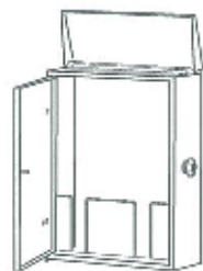
【別途ご用意下さい】